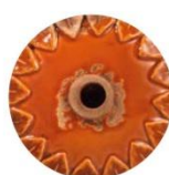
VIO VINTAGE ARANCIO