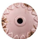
VIC VINTAGE CIPRIA