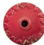
VIR VINTAGE ROSSO