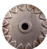
VIT VINTAGE TORTORA