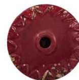
VIX VINTAGE BORDEAUX