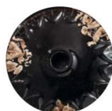
VIN VINTAGE NERO