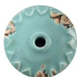
VIA VINTAGE AZZURRO