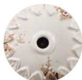
VIB VINTAGE BIANCO