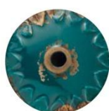
VIV VINTAGE VERDE